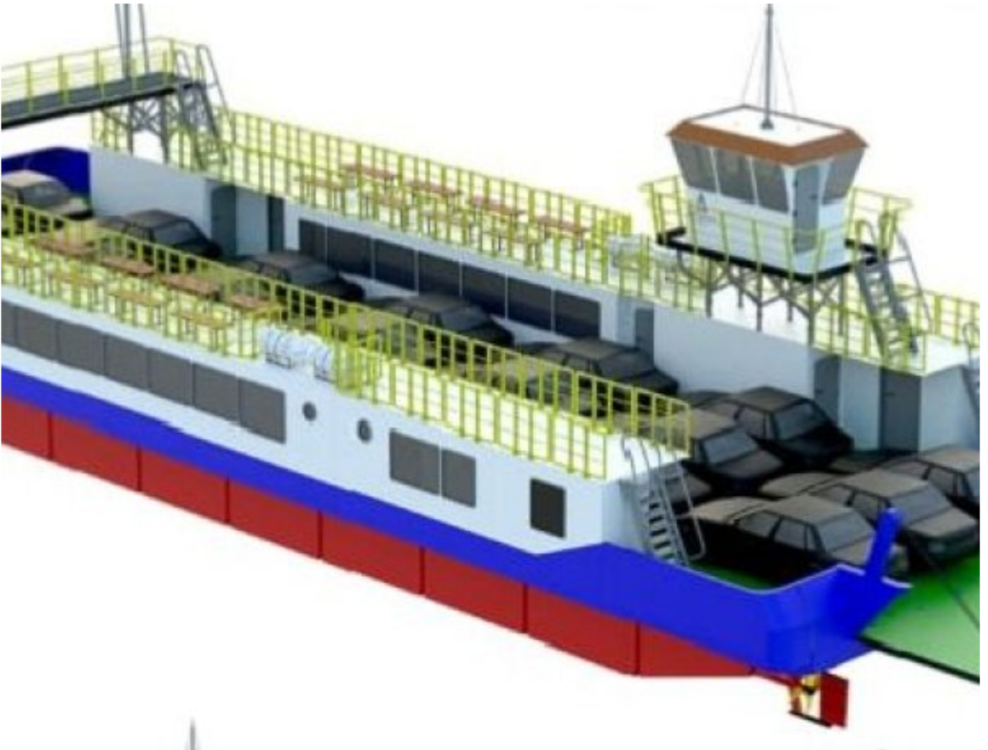
Tesk Foto : Desain Gambar Kapal Motor Penyeberangan (KMP) Sumut III

SIMALUNGUN -Guna memperlancar konektivitas wisatawan dan masyarakat menuju Pulau Samosir, Negeri Indah Kepingan Surga dari Kabupaten Simalungun, PT Pembangunan Prasarana Sumatera Utara (PPSU) akan segera